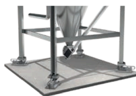
Silo équipé d'un système de pesage