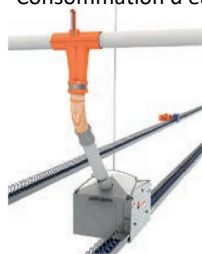
Alimentation ciblée par vanne d'aliments pneumatique